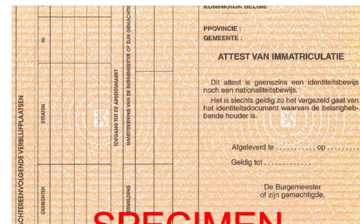
Приклад засвідчення іматрикуляції або ж помаранчевої карти