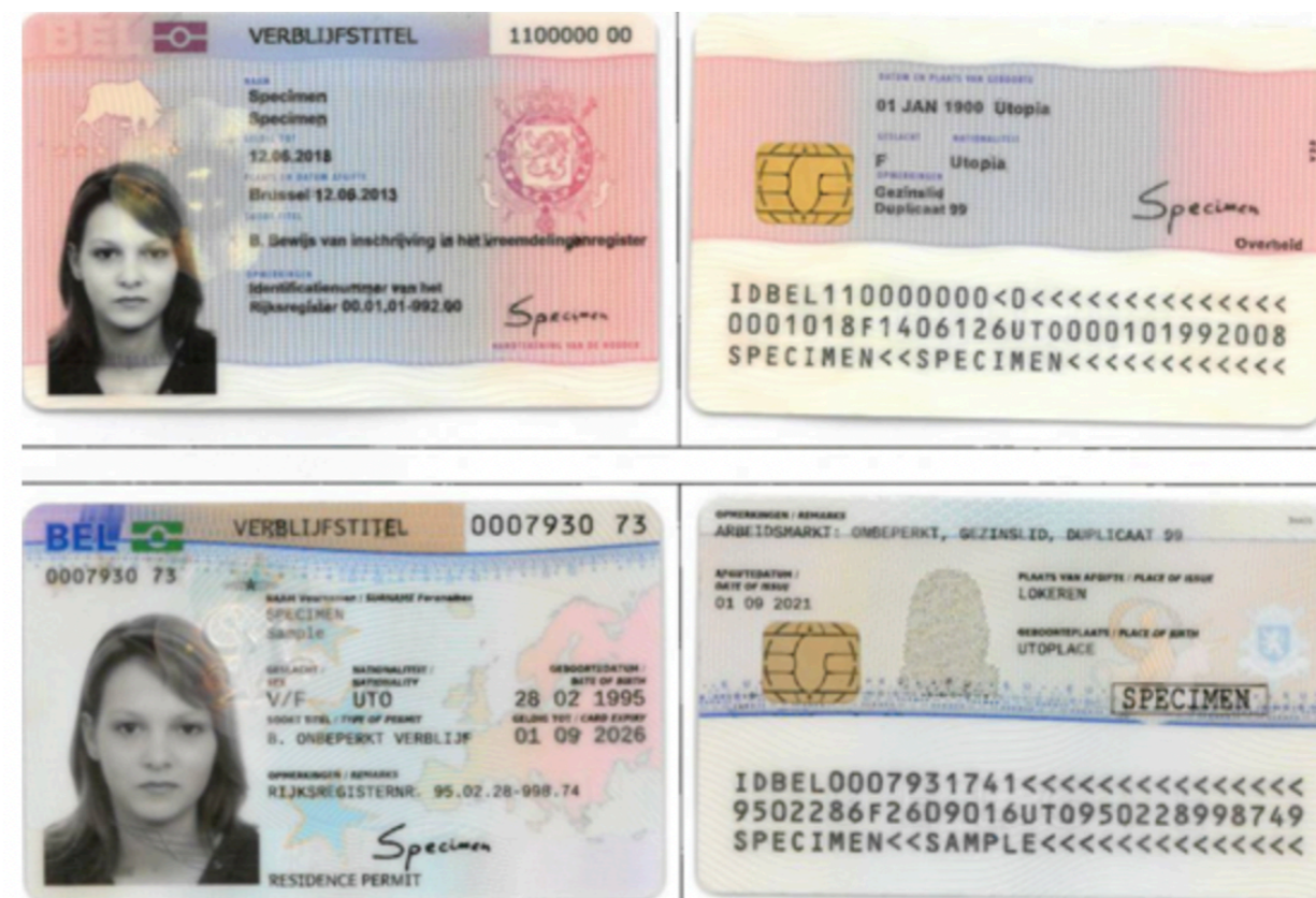
Приклад електронної картки

Ні, помаранчева карта - це посвідчення для громадян третіх країн (= людей, які приїхали з-за меж Європи), які все ще перебувають на стадії розгляду їхньої заяви про надання дозволу на проживання. Тут зазначено, чи можете ви працювати, чи ні.